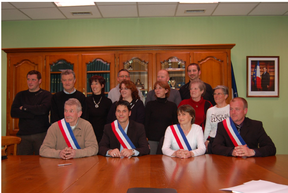
L'équipe du conseil municipal