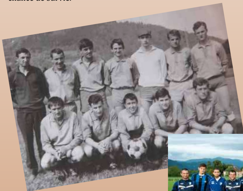
Arthaz Sports 1966

Paradoxalement c'est quand il a déménagé au stade de la Chapelle qu'a commencé une longue période d'instabilité de près de 30 ans avec beaucoup de bas et quelques hauts. Mais depuis 2/3 ans il semble qu'Arthaz Sports ai retrouvé une seconde jeunesse, et s'est même offert comme cadeau d'anniversaire cette année une montée en catégorie supérieure. Bien que ayant du mal a relancer la machine jeune, le club compte actuellement 80 licenciés.