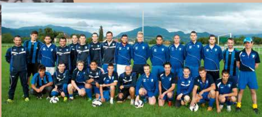
Arthaz Sports 2014