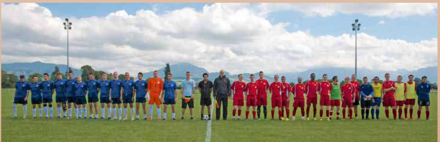
Match amical pour les 70 ans du club