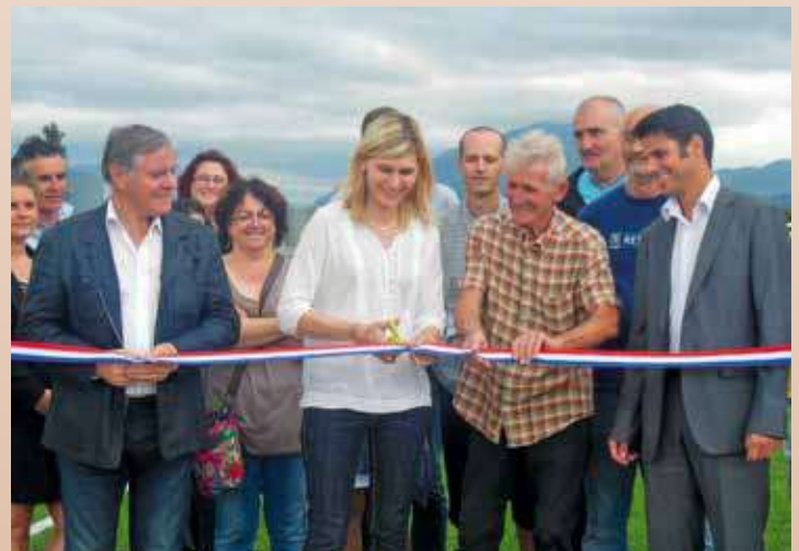
Le terrain synthétique permet de s'entraîner toute l'année, en préservant la pelouse d'honneur