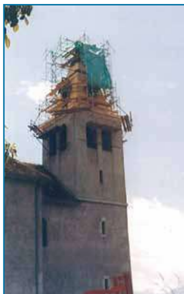
1979 - Rénovation du clocher d'Arthaz